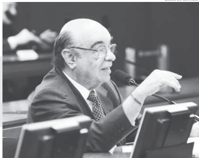
Bonifácio de Andrada afirma que o projeto se enquadra na realidade atual

Projeto de autoria do deputado federal Bonifácio Andrada institui a ação de legalidade de conduta e de inexistência de desrespeito à lei – uma espécie de atestado de boa cidadania